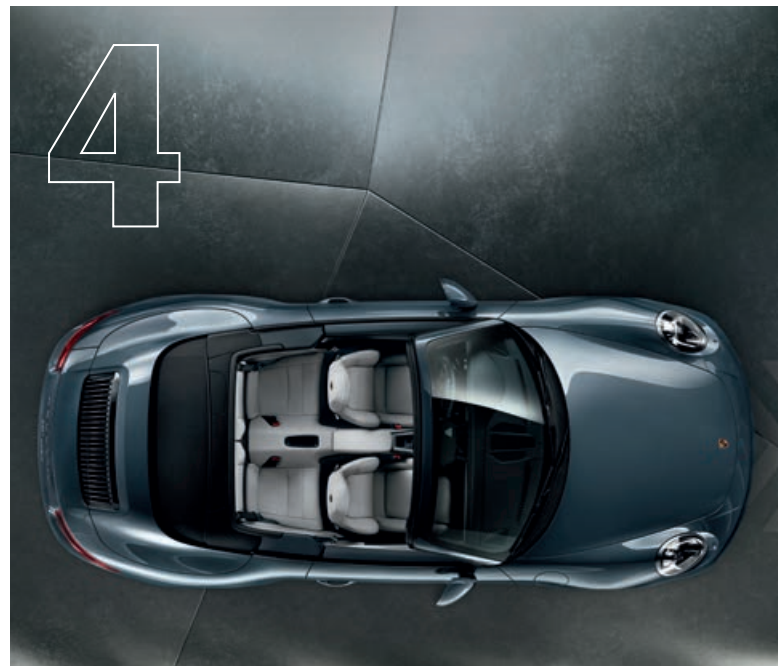
Mehr Ideen pro PS. Der neue 911 Carrera.