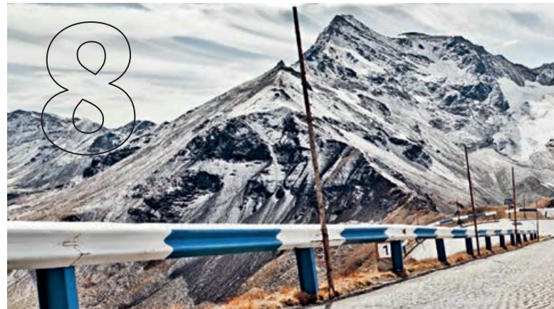
Unsere Highlight-Tour in den Alpen: der Großglocknerpass.

Impressum Porsche Times erscheint beim Porsche Zentrum Fulda, Kahrmann Sportwagen GmbH, Kohlhäuser Straße 59, 36043 Fulda, Tel.: +49 661 96929-0, Fax: +49 661 96929-27, E-Mail: info@porsche-fulda.de, www.porsche-fulda.de; Auflage: 2.000 Stück. Redaktionsanschrift: Porsche Zentrum Fulda, Kahrmann Sportwagen GmbH, Kohlhäuser Straße 59, 36043 Fulda. Für unverlangt eingesandte Fotos und Manuskripte wird keine Haftung übernommen. Die Verantwortung für die redaktionellen Inhalte und Bilder dieser Ausgabe übernimmt das Porsche Zentrum. Ausgenommen davon sind die offiziellen Seiten der Porsche Deutschland GmbH.