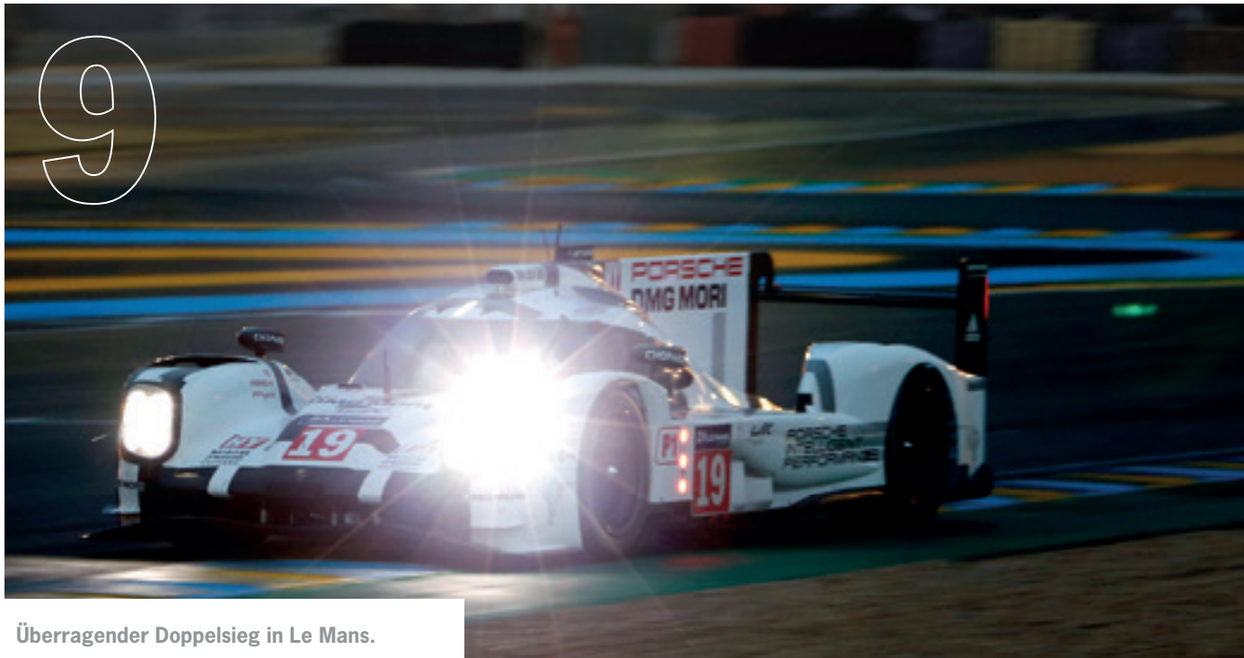
Überragender Doppelsieg in Le Mans.