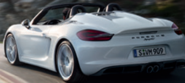
Ungefiltert. Der neue Boxster Spyder.

Porsche Modelle (ohne Plug-in-Hybrid-Modelle) · Kraftstoffverbrauch (in l/100 km): kombiniert 12,7–6,1; CO 2 -Emissionen: 296–159 g/km; Plug-in-Hybrid-Modelle · Kraftstoffverbrauch (in l/100 km): kombiniert 3,4–3,0; CO 2 -Emissionen: 79–70 g/km; Stromverbrauch: kombiniert 20,8–12,7 kWh/100 km