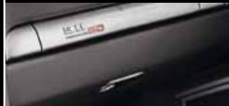
Oberhalb des Handschuhfachs zeigt eine Plakette die Limitierungsnummer an.