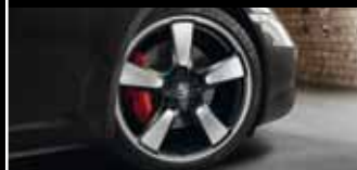
Nicht nur von Sammlern hochbegehrt: die Sport Classic Räder im legendären Fuchselgendingen.

Jubiläumsmodell 50 Jahre 911 mit 7-Gang-Schaltgetriebe in 4,5 s von 0 auf 100 km/h und erreicht eine Höchstgeschwindigkeit von 298 km/h. Ebenfalls zukunftsweisend sind die Verbrauchswerte, die der hohen Leistung des Jubiläumsmodells gegenüberstehen: Denn mit 8,7 l/100 km (in Verbindung mit dem optionalen PDK) liegen sie vergleichsweise niedrig. Grund dafür sind serienmäßige Effizienztechnologien wie Auto Start-Stop-Funktion, Thermomanagement oder Bordnetzrekuperation, die auch im Jubiläumsmodell 50 Jahre 911 integraler Bestandteil des Fahrzeugkonzepts sind.