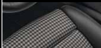
Liebvolle Reminiszenz: Die Sitzmittelbahnen greifen das Pepita-Muster auf, das in den ersten 911 Modellen stilbildend war.