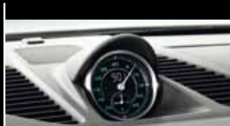
Design-Zitat: Bis 1967 war die Ziffern- und Skalenfarbe der Instrumente grün und die Zeiger weiß.

Schon von außen ist die klassische 911 DNA unverkennbar: z. B. an den rund ausgeformten Scheinwerfern und den Lufteinlasslamellen. Im Jubiläumsmodell sind sie zusätzlich mit Chrom akzentuiert, genau wie das Heckdeckelgitter hinten. Es verrät, wo der Motor sitzt: Sechs Zylinder, in Boxeranordnung, inklusive typischem Porsche Sound. So weit die Tradition. Doch kommen wir zur Zukunft: Denn mit dem Motor des Porsche 911 Carrera S bewegt sich das Jubiläumsmodell eindeutig auf dem neuesten Stand der Zeit. Mit 3,8 Litern Hubraum entwickelt der Motor eine beeindruckende Leistung von 294 kW (400 PS). So beschleunigt das