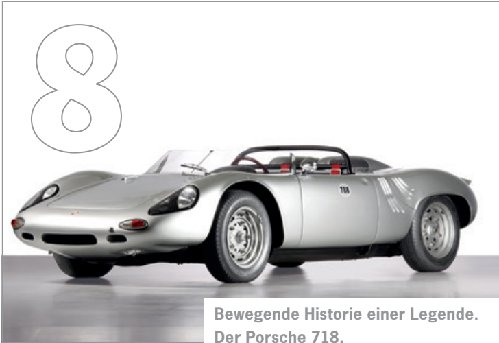
Bewegende Historie einer Legende. Der Porsche 718.