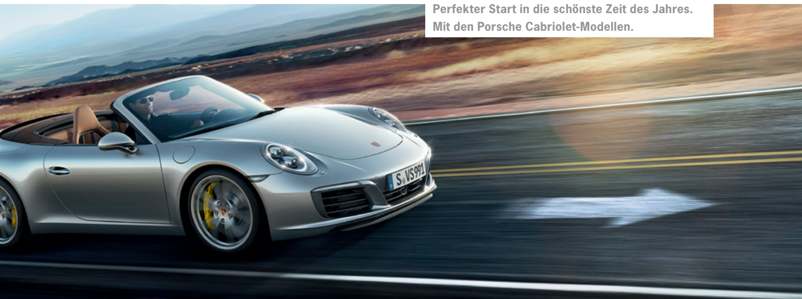
Perfekter Start in die schönste Zeit des Jahres. Mit den Porsche Cabriolet-Modellen.